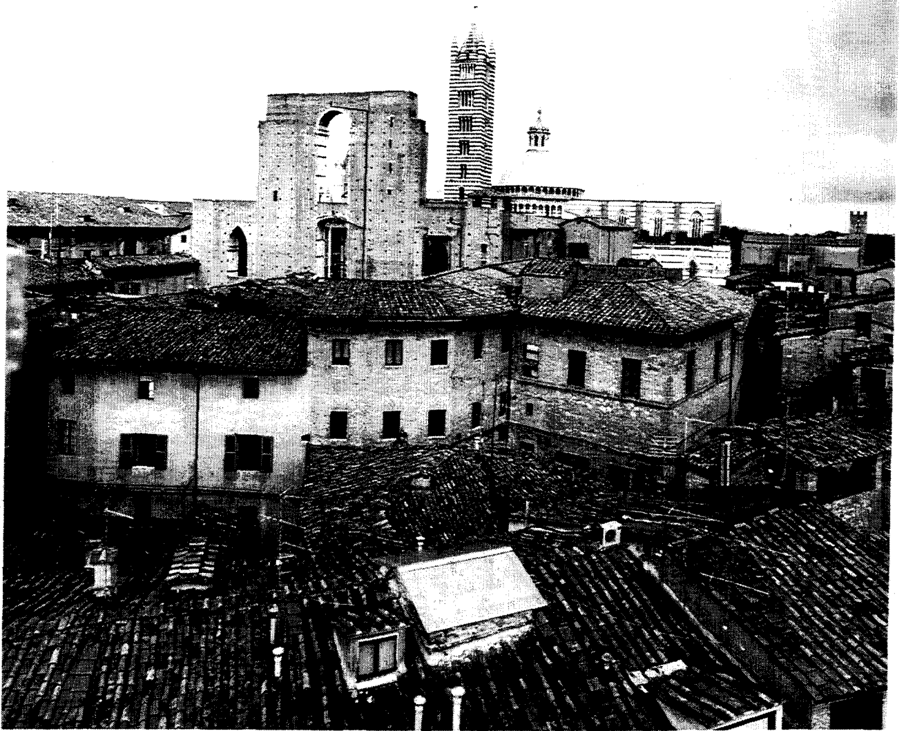
Sienne : vue panoramique / Siena : Panoramic view