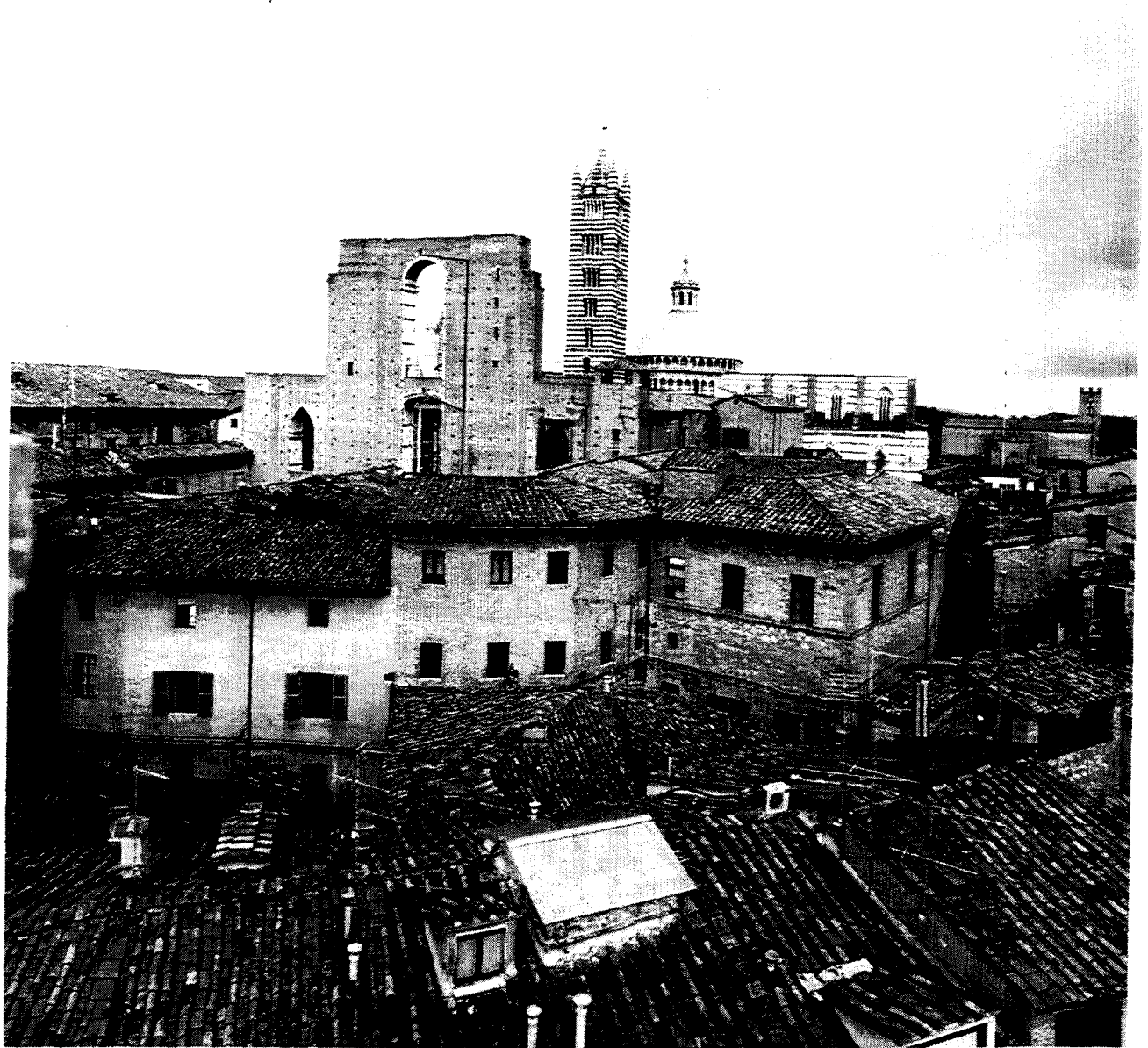
Sienne : vue panoramique / Siena : Panoramic view