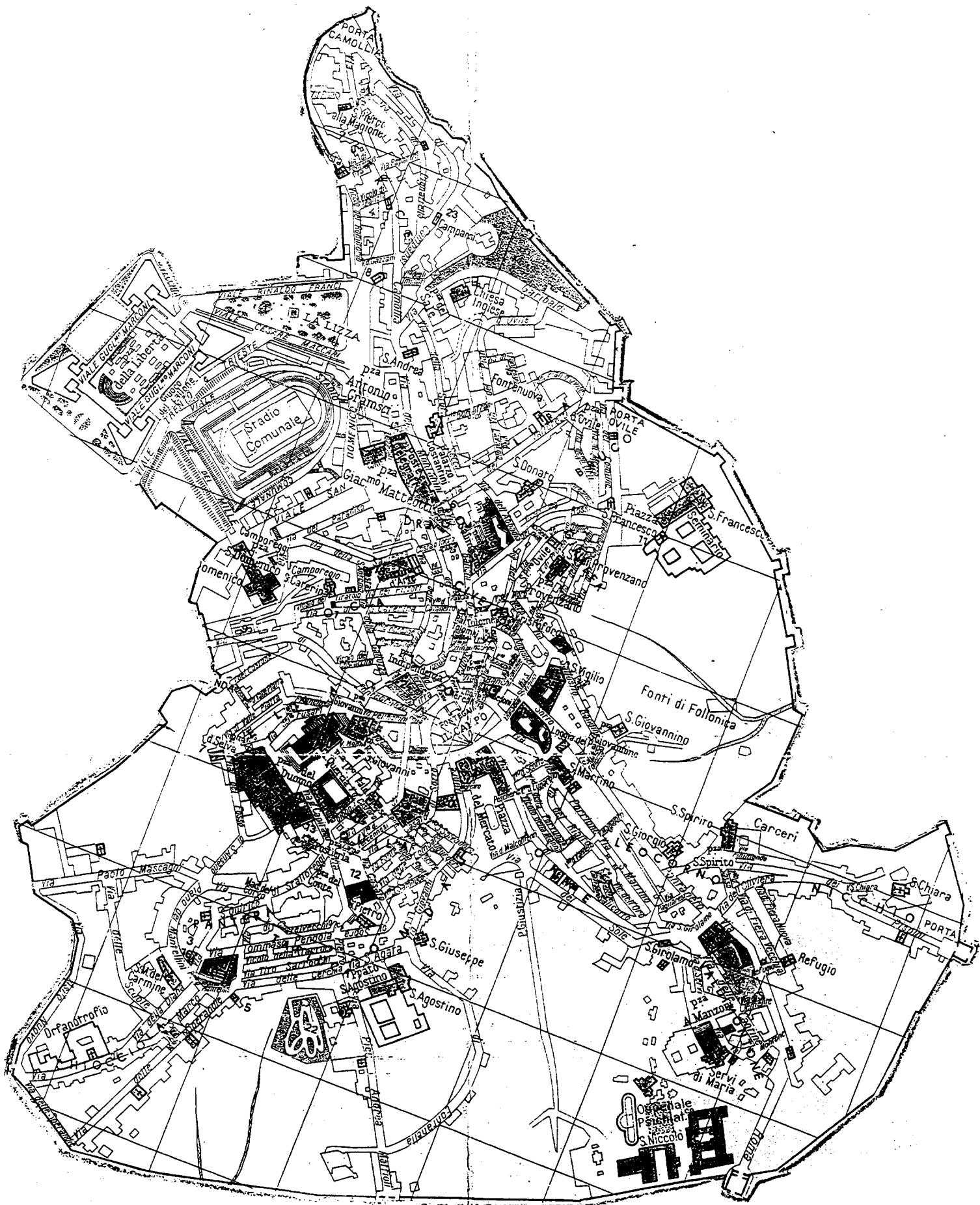
Sienna : plan de la zone proposée pour inscription