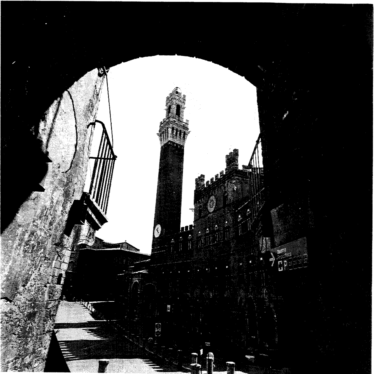
Sienna : le Palazzo Pubblico et la Piazza del Campo / Siena : Palazzo Pubblico and Piazza del Campo