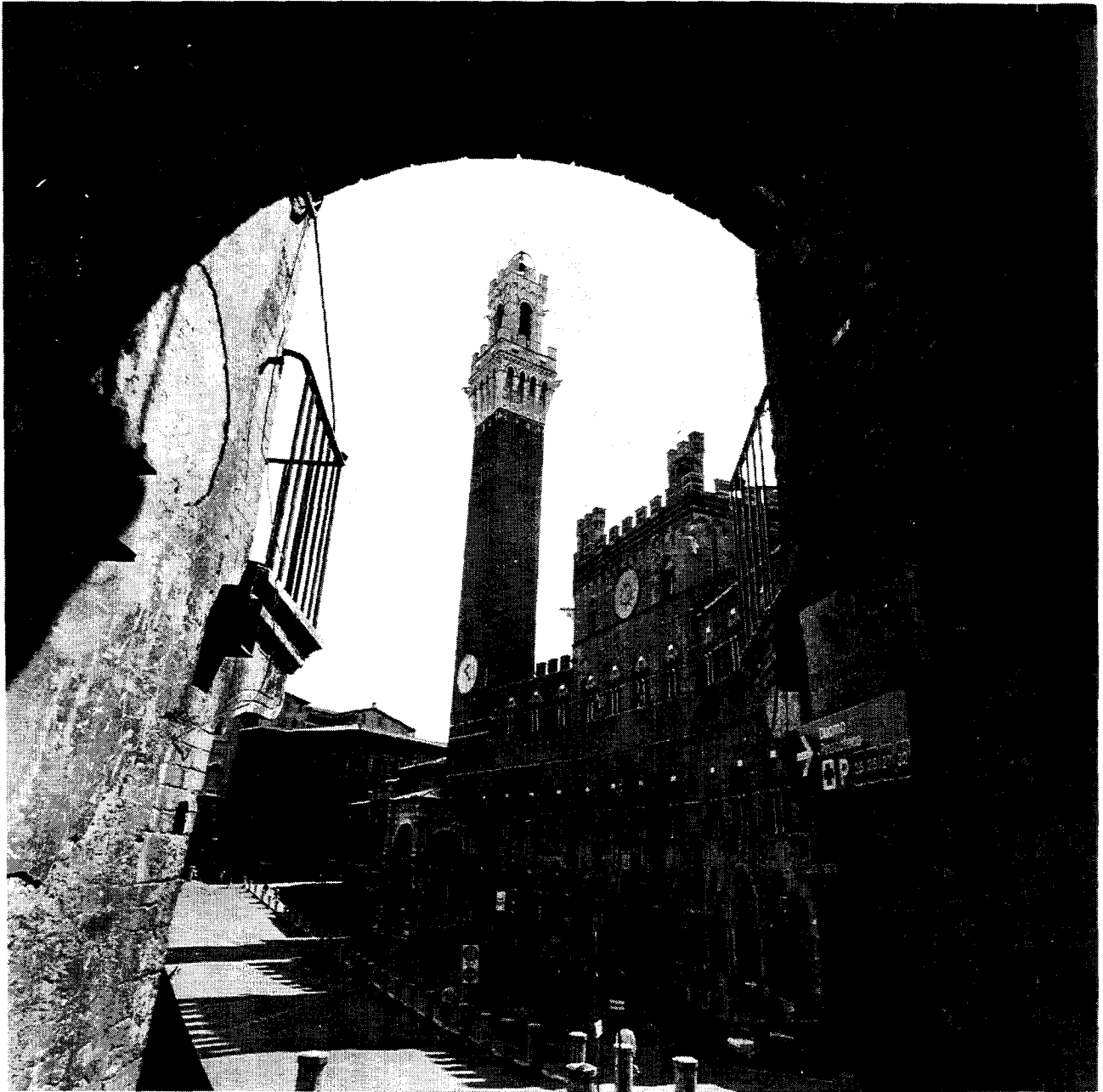
Sienne : le Palazzo Pubblico et la Piazza del Campo / Siena : Palazzo Pubblico and Piazza del Campo